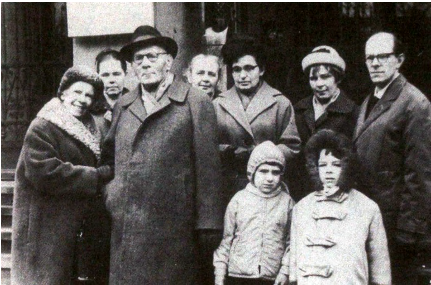
Prof. Stanisław Pigoń przed Collegium Novum w otoczeniu najbliższej rodziny po uroczystości odnowienia doktoratu; 1964

Fot. Franciszek Ziejka. „Jak kochać Polskę? Stanisław Pigońa droga do wielkości, Krosno 2021