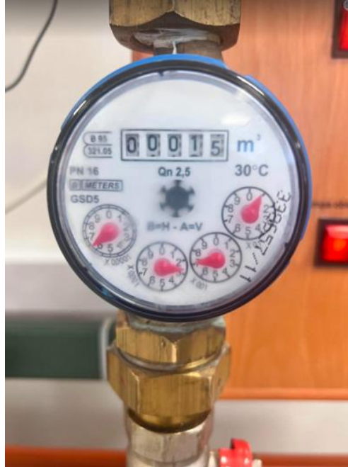
Rys. 2. Wodomierz używany do odczytu objętości przepływającej wody.