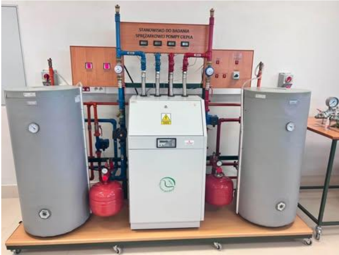
Rys. 1. Stanowisko demonstracyjne sprężarkowej pompy ciepła wykorzystywane w ćwiczeniu.